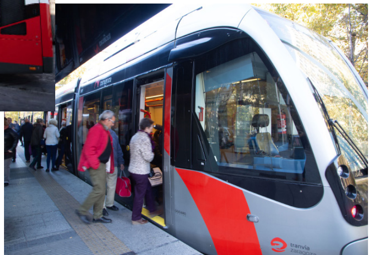
Tranvía en parada