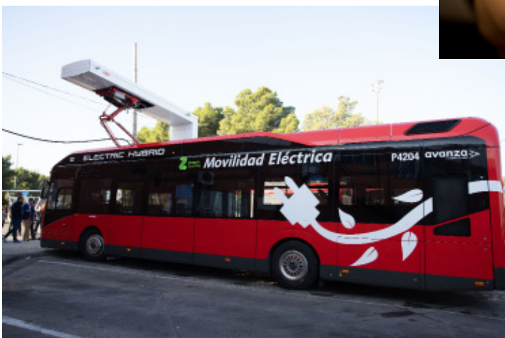
Recarga de autobús en Avanza